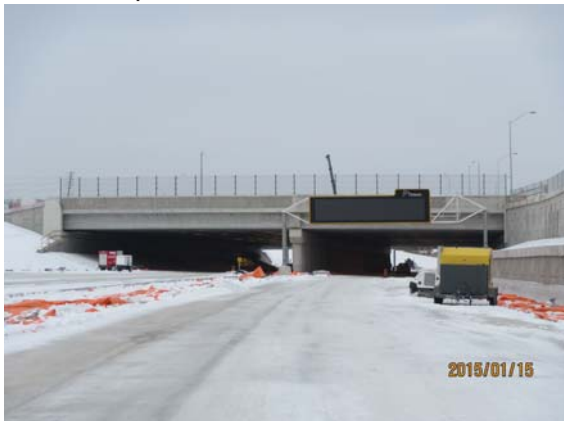
nouveaux ATMS signes

A. J'encourage les gens à retourner en arrière et à constater à quel point les configurations et les déplacements de circulation ont changé sans que celle-ci soit perturbée.