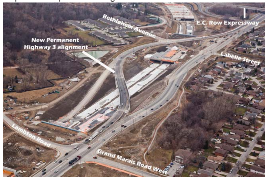
photo aérienne de l'autoroute 3 est

Les conducteurs et les résidents peuvent maintenant voir les nouvelles structures à tours qui sont érigées à côté de la route. Il s'agit des fondations des passerelles. Ces dernières seront construites au cours du printemps. D'autres travaux paysagers seront amorcés lorsque les températures augmenteront.