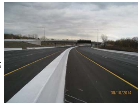
voies nouvelle E.C. Row

La Police provinciale de l'Ontario était sur place pour aider l'équipe du projet à effectuer la plupart des déplacements de circulation. Les abonnés à Twitter auraient vu des gazouillis concernant un « presque arrêt ». Ainsi, nous pouvons garder la route ouverte, car les voitures de police dirigent la circulation vers le nouveau tracé à vitesse réduite pendant que les équipes devant elles retirent les barricades et tracent les lignes sur la route.