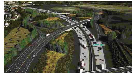
Une interprétation d'artiste du bout est du futur Parkway, à proximité du rond-point de l'autoroute 3.

Pendant la fin de semaine du 20 août, l'autoroute 401 en direction est a été fermée entre la route 3 et la route provinciale, et en direction ouest entre la rue Manning et la route 3 à partir de 3 h pour pouvoir procéder à la démolition du pont de la rue Talbot Nord surplombant l'autoroute 401. Le pont de la rue Talbot Nord doit être remplacé pour permettre l'élargissement de l'autoroute 401 de quatre à six voies dans le cadre du projet de l'autoroute. Les équipes ont travaillé sans interruption pour démolir le pont et ont pu finir bien avant les délais prévus. L'autoroute 401 fut rouverte à la circulation à 16 h 30 le dimanche 21 août. Les travaux se poursuivent en ce qui concerne l'élargissement de ce tronçon de l'autoroute 401.