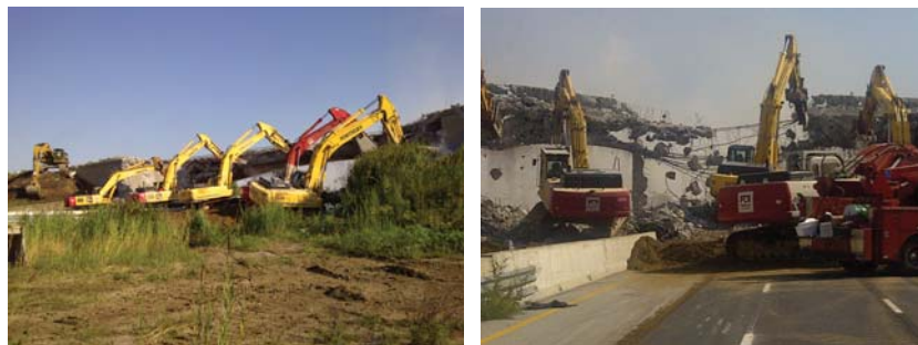
Les équipes Parkway travaillent pour enlever le pont North Talbot Road situé au-dessus de l'autoroute 401.

Depuis, les équipes préparent le reste du couloir pendant la prochaine phase des travaux de construction. Voici certains des travaux de construction effectués :